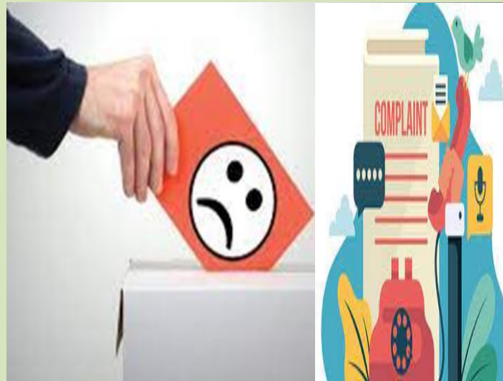
PSEA Community Outreach and Communication Fund